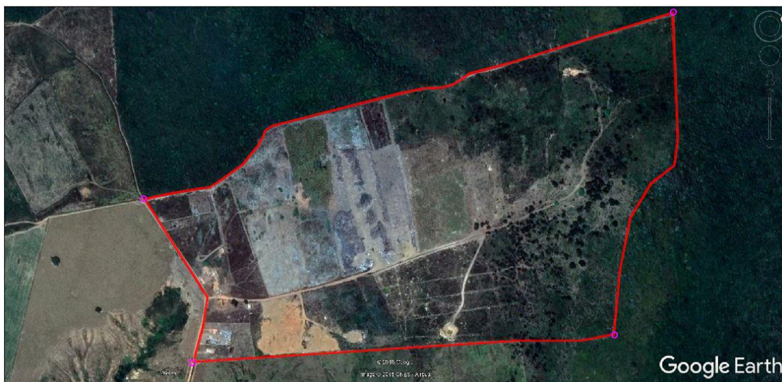
Área sugerida para implantação do aterro sanitário e da usina de RCD, no município de Frei Paulo.

A área escolhida não possui, em um raio de 1.500 metros de distância, nenhum núcleo populacional, tornando a área adequada para implantação.